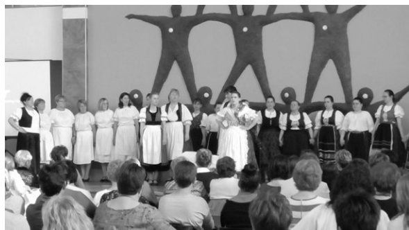
Sárosdi Napraforgó Dalkör