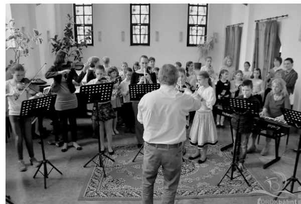
A versenyzőkből alakult ad hoc zenekar a díjkiosztón.

Az eredmények azt bizonyították, hogy a tanulók jól felkészültek, tudásuk legjavát adták. Sok maximumpontos írásbeli és kiváló lapról olvasási eredmény született. A népdalok örömteli, szép éneklése is emelte a verseny színvonalát. Jó volt látni a mosolygós gyerekeket, szüleiket és tanáraikat az eredményhirdetési ünnepségen. Jól oldották a verseny izgalmát és változatosan egészítették ki a zenei délelőttöt a játékos programok. Szébbnél szébb „műalkotások” készültek Berlioz Fantasztikus szimfóniájának és Muszorgszkij Egy kiállítás képei c. zeneművének hallgatása közben.