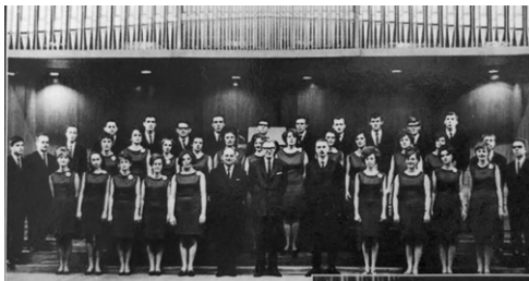
A 10 éves kórus – 1968