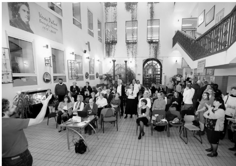
Közös éneklés az emlékkoncert végén