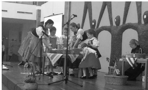
Sátoraljai Hétszínvirág Művészeti Bázisóvoda

teszi magyarrá a gyermekeket. Az előadások gyönyörű íve megerősítette bennünk az alapértékeket. Erre tette fel a koronát az óvodák műsora.