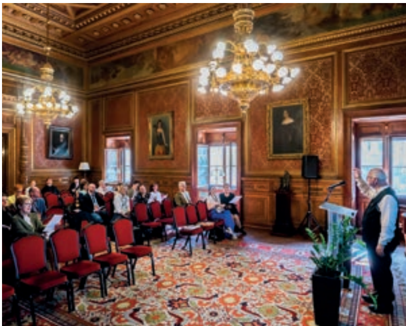
Sapszon Ferenc vezényel

helyzetek, életérzések a mai diákok számára elevenek, átérezhetőek legyenek. Ettől remélhető, hogy a gyerekek szívesen éneklék a népdalokat.