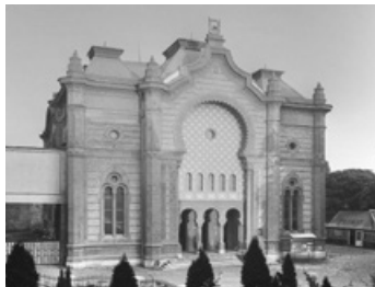
Ungvári Filharmónia épülete

A Kossuth-díjas felvidéki író Dobos László biztatását megfogadva a Lavotta János Kamarazenekar a magyar verbunkos zenét ezúttal a kárpátaljai közönség számára tette hallhatóvá. Az együttes a millennium évében egyszer már hangversenyezett a hajdani vármegye székhelyén, Ungváron. Akkori hangversenyük az Ung-parti városban szimbolikus volt, hiszen a kamarazenekar pár nappal előtte fejezte be millenniumi CD-jének felvételét a Magyar Rádió stúdiójában. A lemez tartalmazta Mosonyi Mihálynak, az első magyar kantáta szerzőjének, a Kazinczy Ferenc hasonló című versére írt Tisztulás ünnepe az Ungnál 886-ik esztendőben szoprán, tenor és basszus énekhangra, kórusra és nagyzenekarra komponált művét. Az Ungvári Filharmónia (a volt zsinagóga) impozáns nagyterme számos világhírű művész fogadott pódiumán, a helyi kollégák szerint Ojsztrah, Kogan, Richter, Rosztropovics, Gidon Kremer, legtöbbször ungvári hangversenyük után indultak európai – köztük magyarországi – turnéjukra. A Lavotta János Kamarazenekar verbunkos-estje a tagjai számára talán ezért is megbecsült, felejthetetlen emlék.