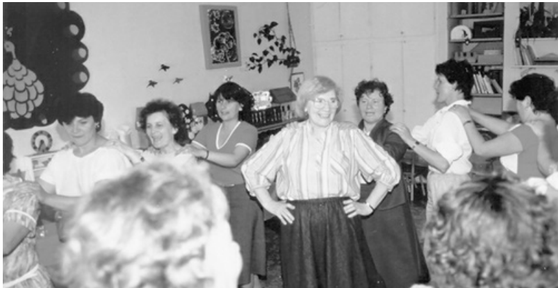
Felnőttek továbbképző tanfolyamán, közös játék közben