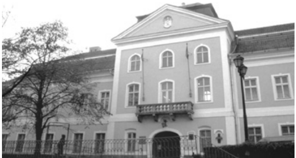
A volt megyeháza épülete

Ungvár középkori történetét a Vereckeai hágón átkelt magyar seregek alakították azzal, hogy a források szerint 894-ben Laborc fejedelemtől a várost elfoglalták. Anonymus krónikájában az szerepel, hogy Álmos Ungváron adta át a fővezérséget fiának, Árpádnak. Innen eredhet Árpád „hungvári vitéz” elnevezése. A város egyike volt a Szent István király által létrehozott, s végvári funkciót betöltő várispánságnak. A súlyos károkat okozó tatárjárás után felálló vármegyrendszer kialakulásakor azonban Ung vármegye a szomszédos Nagykapos központtal jött létre. A mintegy ötszáz éven át tartó állapot 1769-ben változott meg oly módon, hogy a megyeszékhely Ungvárra került át. Ekkor épült fel