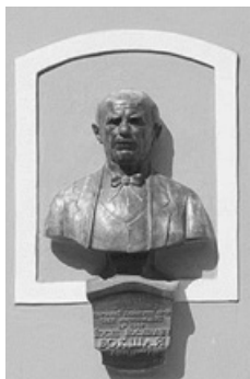
Boksay József portréja

a ma is látható megyeháza, amelynek falai között a szovjet időben a Kárpátaljai Megyei Szépművészeti Múzeum kapott helyet. Az U-alaprajzú, klasszicista stílusban épült megyeháza napjainkban is impozáns épülete a városnak. A független ukrán állam megalakulásakor a múzeum Kárpátalja neves festőművésze, Boksay József nevét vette fel. Az Európát tanulmányutakon bejárta sokoldalú művész a freskók, portrék, életképek, csendéletek festése mellett főképpen a tájképfestésnek (plein air) szentelte idejét. A múzeumban kiállított anyag, melyek között néhány Munkácsy-festményt is megtekinthet a látogató, névadójának méltó emléket állít.