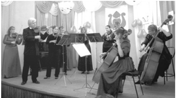
A művészeti iskola színpadán

A jó hangulatú hangverseny-, és szívélyes vendéglátás után szembeülhettem magam is napjaink történelmének borzalmas következményeivel. A hirdető tábla szerint ez a groteszk háború a fájdalmas gyász képében a művészeti iskola falai közé is behatolt a tudósítással, hogy az ukrán-orosz konfliktusnak egy volt hangszeres fiatal is áldozatául esett. Miért?...Miért?!