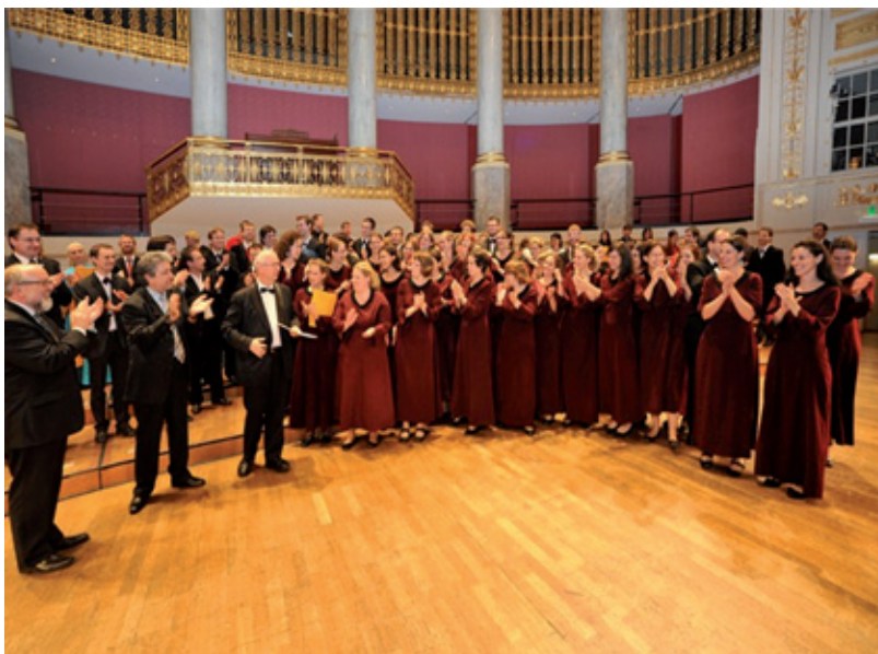
Konzerthaus Wien – Großer Saal – Díjkiosztás

Különdíjat kapott a Schubert: Gott im Ungewitter mű legszebb tolmácsolásáért.