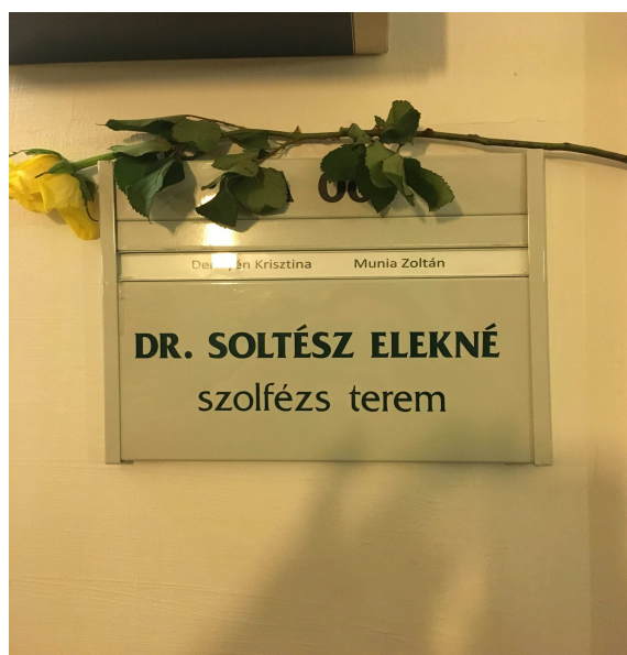
A szolfézs terem