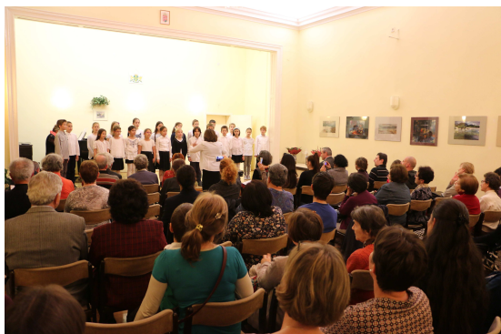
A szolfézs csoport műsora