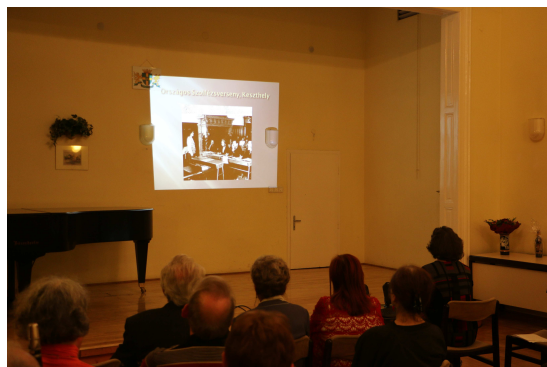
Vetítés – Országos Szolfézsverseny, Keszthely